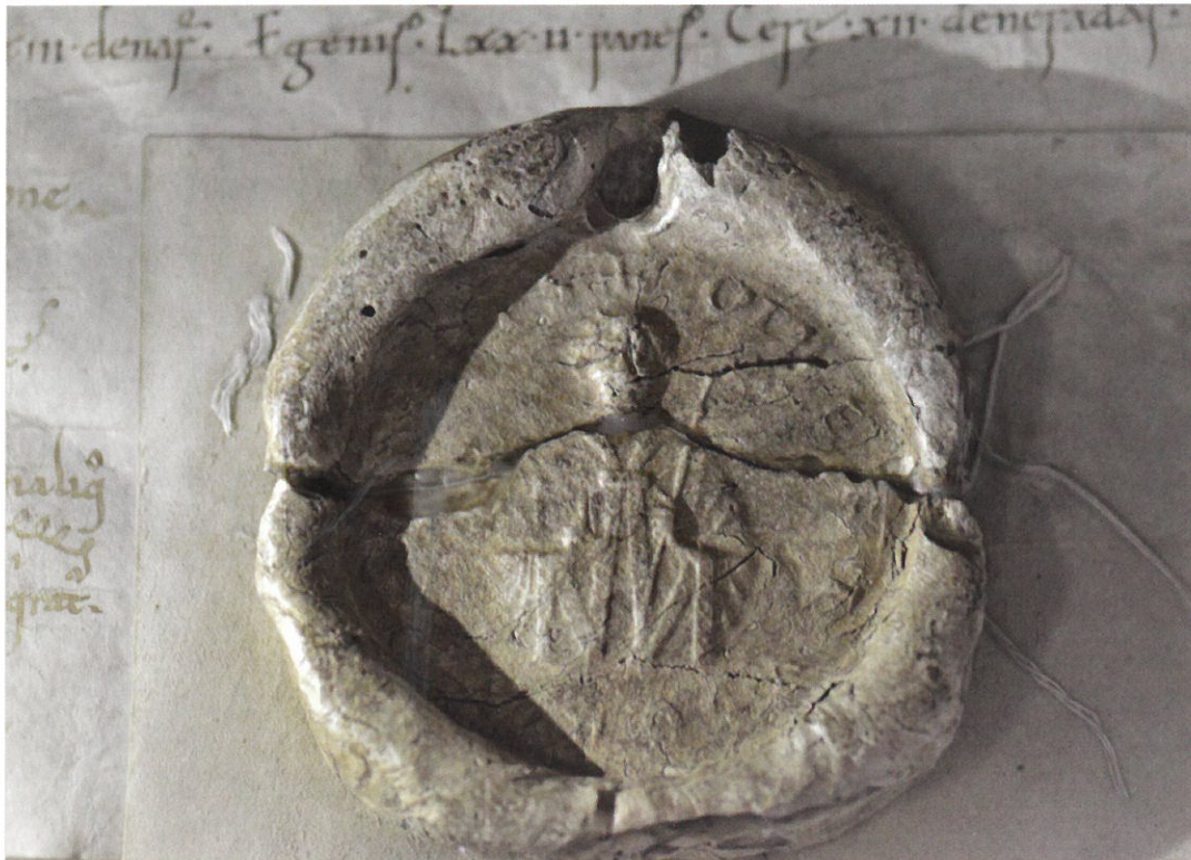
Zegel op de oudste Limburgse oorkonde

bereiding van de eerste kruistocht. In deze oorkonde verklaart Ida van Boulogne, de moeder van Godfried van Bouillon, die de eerste kruistocht leidde, dat zij bepaalde landerijen overdraagt aan het stift van Munsterbilzen.