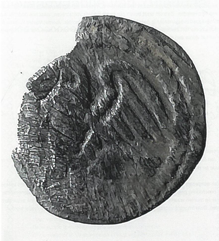
Obool Gelre keerzijde

Op de voorzijde staat de voorstelling van een gemijterde bisschop met een staf in de rechterhand. Het boek dat hij in de linkerhand houdt is door de beschadigingen nog moeilijk te zien. Op de keerzijde staat - in een parelcirkel - een naar links stappende arend die zijn vleugels uitslaat. Dit muntje wordt door specialisten beschreven als een obool die ten tijde van de Luikse bisschop Hendrik van Gelre (1247-1274) in Luik geslagen werd 1 .