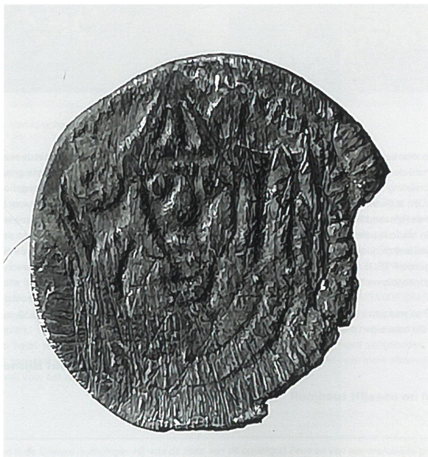
Obool Gelre voorzijde

In mei 2020 werd in Sint-Truiden een beschadigde obool gevonden. Het muntje weegt 0,40 gram en heeft een diameter van 10 mm. Het is op twee manieren beschadigd. In de eerste plaats is er een behoorlijk stuk van het muntje afgebroken, en voorts vertoont het diepe schuursporen. Wellicht is het in de loop van de eeuwen op een harde ondergrond terechtgekomen en heeft het daar over geschuurd. Gelukkig zijn de voorstellingen op voor- en keerzijde nog goed te herkennen.