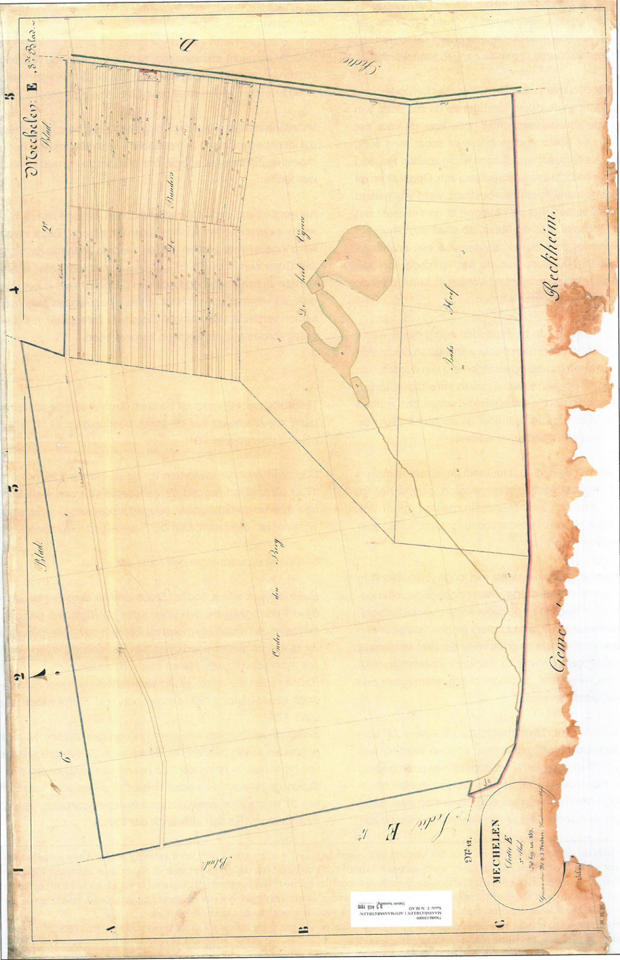
73048503: detailkaart van de oorspronkelijke kadasterkaart van Daatgimbe van omstreeks 1845, met de Helvijvers.