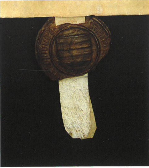
fig. 49 Zegel met centraal wapenschild graafschap Loon