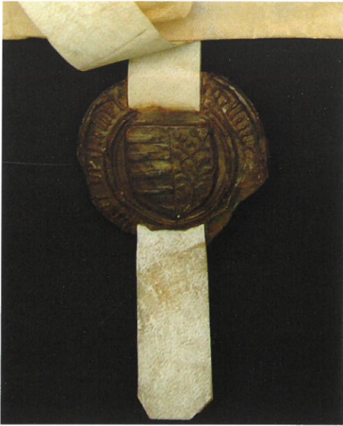
fig. 48 Zegel met centraal wapenschild van de stad Hasselt

voertijden gehalden heeft. Naast de tienden van vlas en kemp, werden ook de lammertienden en de ganzentienden buiten deze verpachting gehouden.