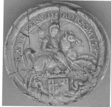
Afbeelding 3: Afgietsel van het zegel van de schepenbank van Boorseem uit 1782 (Rijksarchief Hasselt, Verzameling zegelafgietsels , nr. 1531).

ving van het wapen van de familie de Lynden luidt “gevierendeeld, 1 en 4 van keel met een kruis van goud, 2 en 3 van goud met een leeuw van keel, met over alles heen een hartschild van lazuur met een adelaar van zilver” 2 .