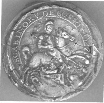
Afbeelding 2: Afgietsel van het zegel van de schepenbank van Boorseem uit 1777 (Rijksarchief Hasselt, Verzameling zegelafgietsels , nr. 630).