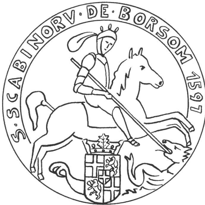
Afbeelding 4: Tekening van het zegel van de schepenbank van Boorseem in R. Verbois, M. Maesen, Geschiedenis der keizerlijke baronie Boorseem .

In de beschrijving die wijlen pater Verbois gaf van het zegel van de schepenen van Boorseem, plaatste hij het familiewapen met de Rekemse versie, met het kruisje in het hartschild, in de voet van het zegel. Of hij dat deed omdat hij eerder, in zijn publicatie over Rekem, ook al het 20 ste -eeuwse gemeentewapen van Rekem op een tekening van het schepenbankzegel van Rekem gepubliceerd had is niet zeker, maar wel waarschijnlijk 5 . Hij geeft immers in zijn werk zelf aan dat hij niet over een andere afdruk van het zegel beschikte dan degene die in deze bijdrage ter sprake komen 6 . Aangezien op deze afdrukken niet te zien is wat er op het hartschild staat, moet de tekening in het werk van pater Verbois voorlopig beschouwd worden als een artist's impression , eerder dan als een getrouwe weergave van alle details van het zegel. Tot dat een meer volledige afdruk van het schepenbankzegel aangetroffen zal worden blijft het onzeker wat er precies op het hartschildje afgebeeld wordt.