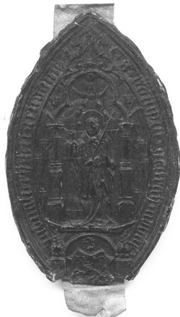
Zegel onder de aanstellingsbrief van Philips van Mettecoven.