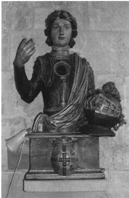
Borstbeeld met relikwie van Sint-Gangulfus