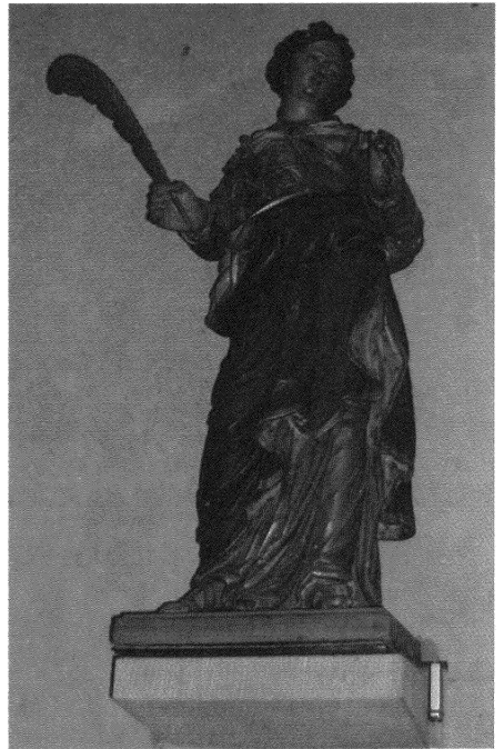
Beeld van Sint-Agtha. De Agatharelikwie werd in 1805 verworven