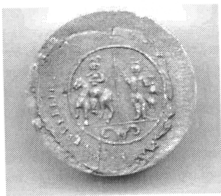
Afgietsel van het zegel van 23 november 1734.

De akte is op papier gesteld en het zegel is in rode lak op het papier gedrukt. Doordat het zegel onoordeelkundig werd aangebracht en er zwart roet vermengd werd met de rode lak, is de afbeelding op het zegel niet goed zichtbaar. Bovendien werd er te weinig lak gebruikt, zodat niet het hele zegel in de lak gedrukt kon worden. Met name van het randschrift werd slechts een deel afgedrukt. Naast dit originele zegel, beschikt men in het Rijksarchief ook over een afgietsel van hetzelfde zegel. Op het afgietsel is beter dan op het zegel zelf te zien wat er voorgesteld wordt.