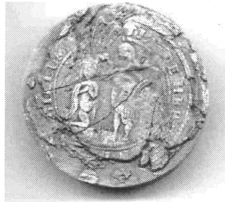
Afgietsel van het zegel van 26 november 1775.