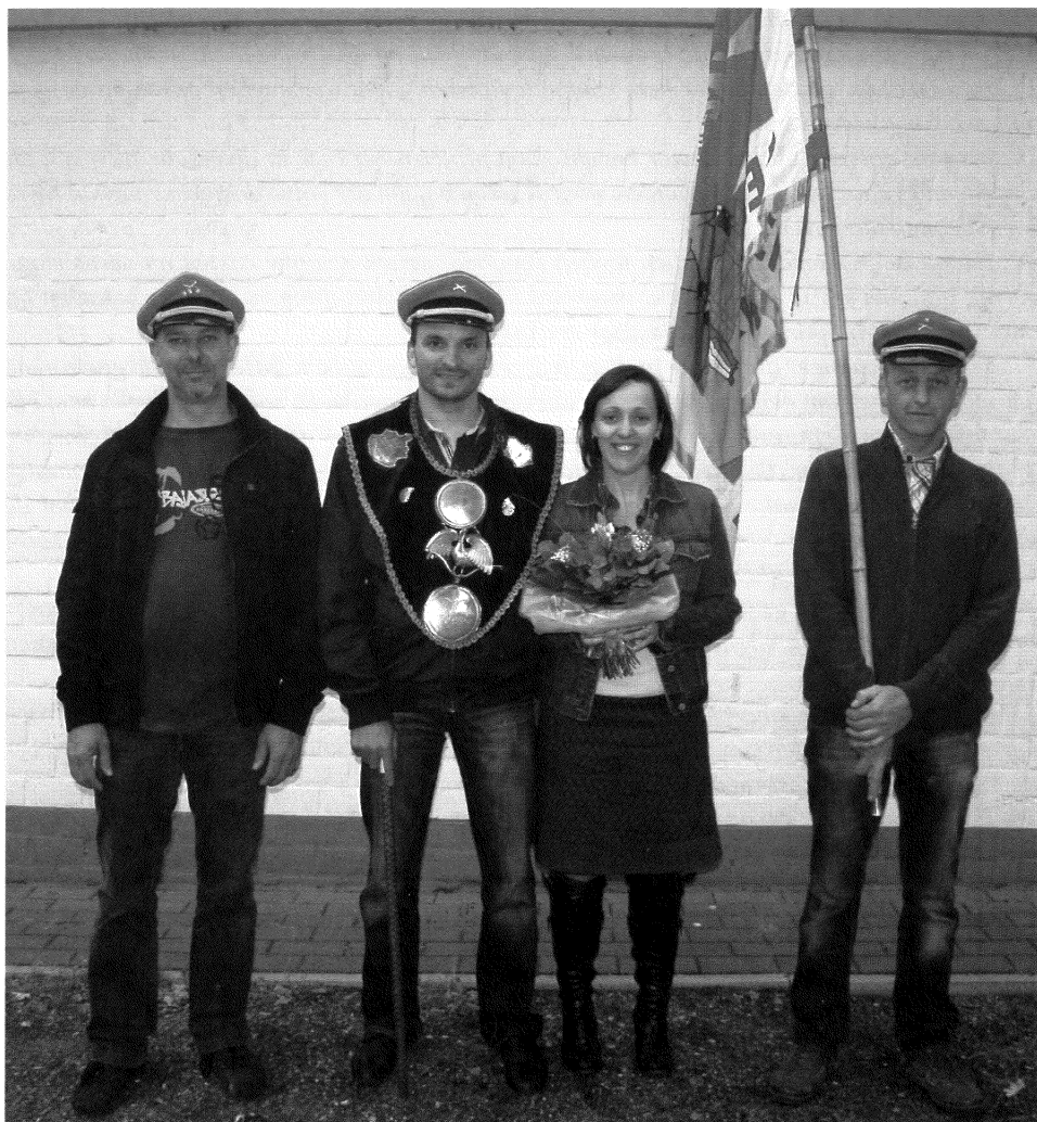
Viering van de schutterskoning van Geneiken in 2010.