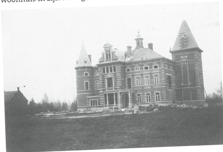
Het kasteel van het Hamel tijdens de verbouwingswerken door Henri van Willigen

Het feit dat het Hamel na het overlijden van Marie-Louise de Glavany niet meer bewoond werd, samen met de oorlogsomstandigheden, die het domein niet spaarden, hadden voor gevolg dat het kasteel er na de Tweede Wereldoorlog beschadigd bijlag. Volledige restauratie werd geen haalbare kaart geacht. In plaats daarvan werd er in 1947 voor geopteerd het 19e-eeuwse kasteel af te breken en het oude woonhuis in zijn oude glorie te herstellen.