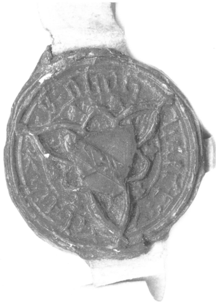
Zegel van Goyvaerts Claes.

k van Spalbeke, ende Lambrecht egeliken die dese van Donck ons rs van Sintruden erdige heere van breke van sinen op zeker pande kende] is, het sy hen metten recht, nisse wisen totten hon reesch ende lbeke met synen e es ons scoutet al tyt gesien ende van Donck coemt n den pertien die voede, die heeren vorseven ende die goede inder