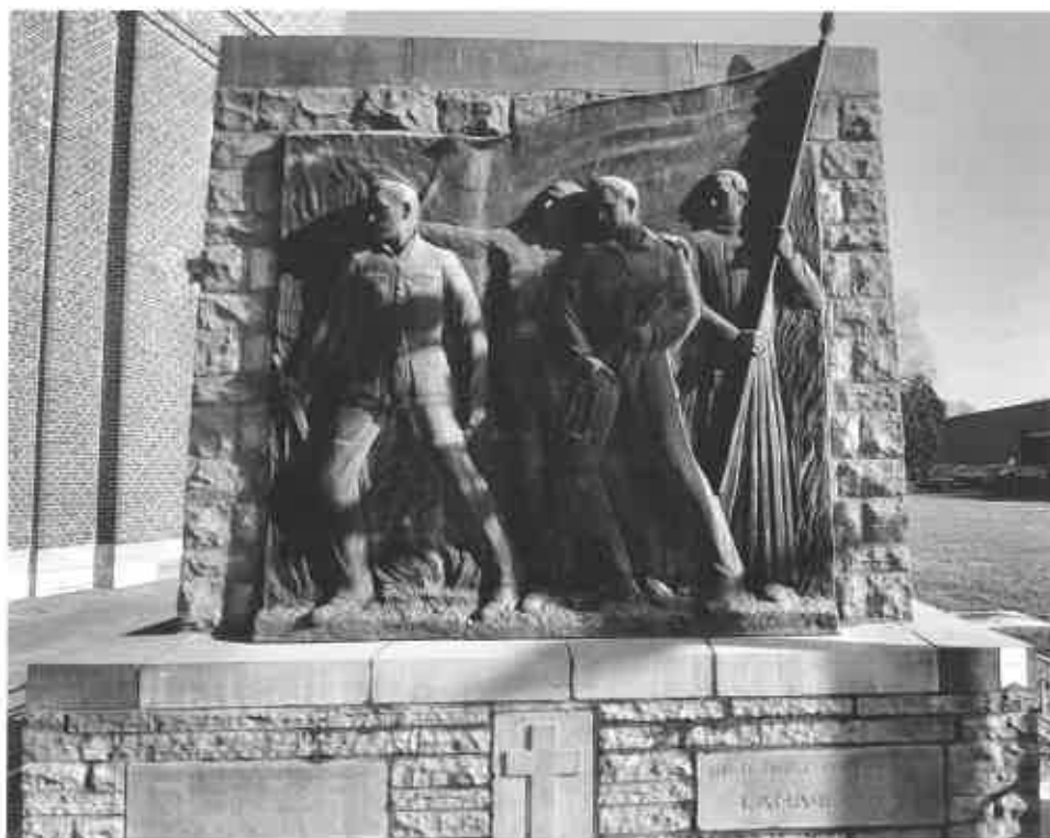
Herdenkingsmonument voor de weerstanders van de familie Lambrechts en provinciaal monument voor de Weerstand in Wijer.

Zware schadegevallen zijn dikwijls het gevolg van onbedoelde luchtbombardementen. In maart 1941 lost een geallieerd vliegtuig zijn bommen boven Schelfhei. In november 1943 stort in een boomgaard op Zwarteinde in Wijer een geallieerde bommenwerper neer. In