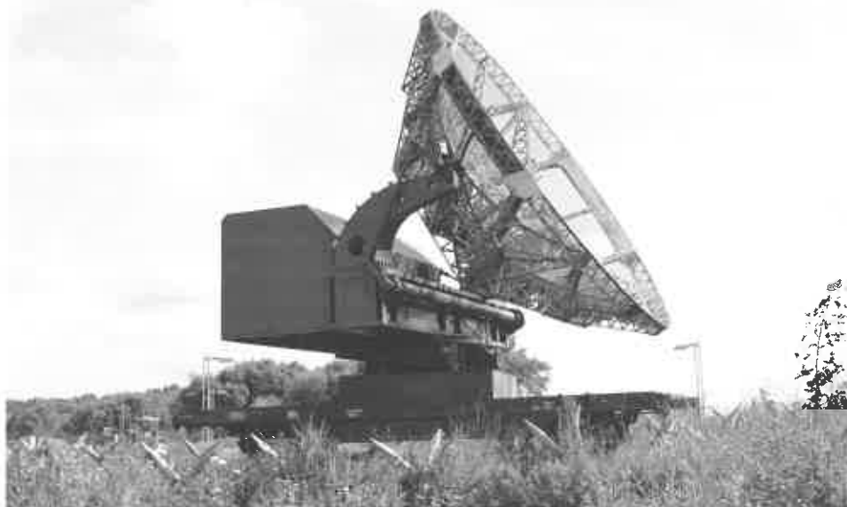
Een Duitse radar zoals die in Nieuwerkerken.

Zijn drie jaar jongere broer Urbain is einde april 1945 overleden in het concentratiekamp van Ravensbrück in het latere Oost-Duitsland.