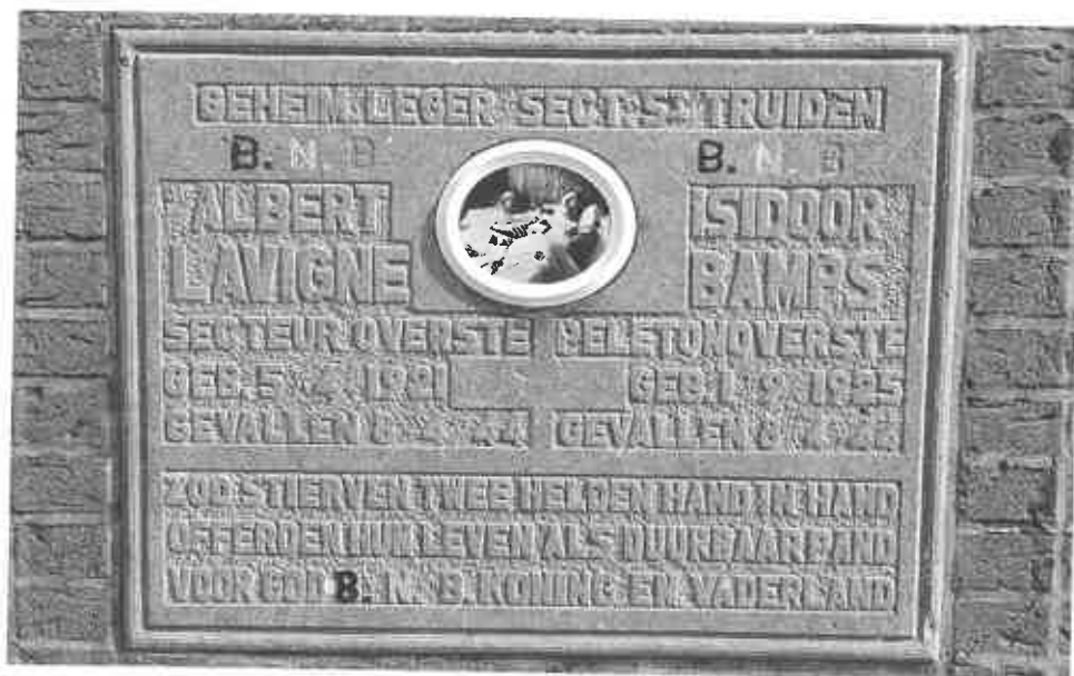
De gedachtenissteen voor de slachtoffers van de verzetsactie van 8 april 1944 in Geetbets.

de bewaarde dossiers ook de laatste die materiële schade te betreuren heeft: in de loop van september 1944 stelen terugtrekkende Duitse soldaten zijn paard.