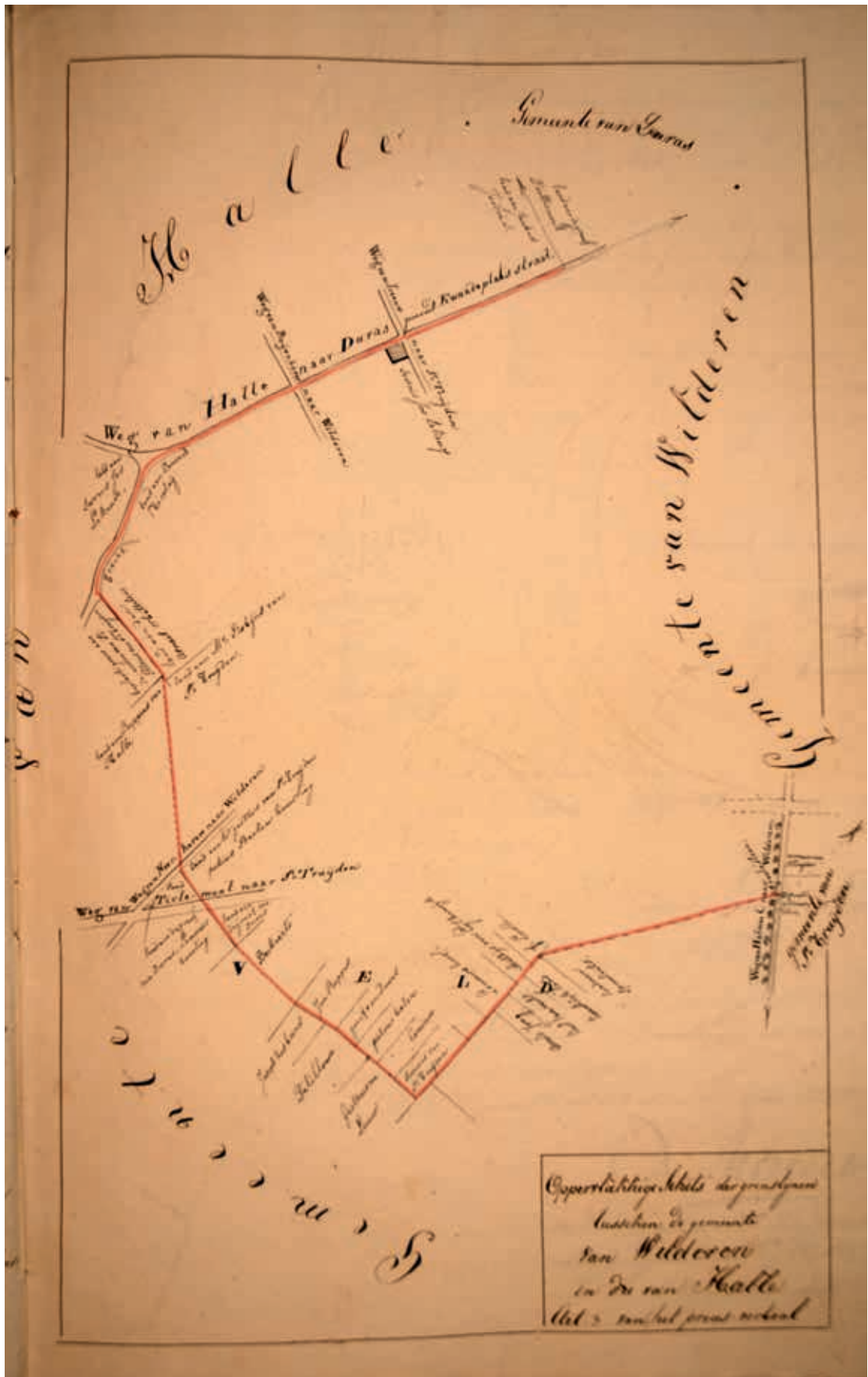
Schets van de grens van Wilderen met Halle. De grens loopt deels door het veld en volgt deels het traject van de Kwaadeplatstraat, die Halle met Duras verbindt.