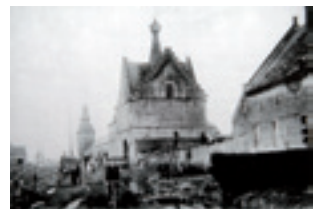
Hasselt, Rijksarchief, Poortgebouw van de abdij omstreeks 1900